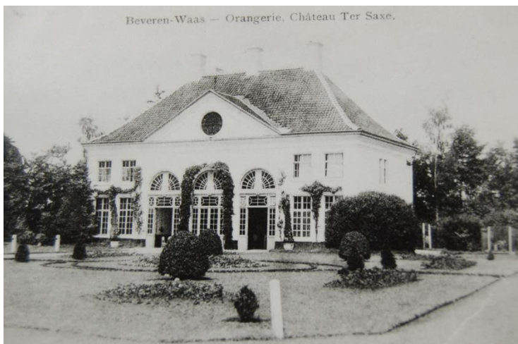
Oranjerie Hof ter Saksen begin 20 ste eeuw