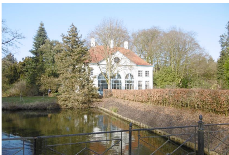
Oranjerie Hof ter Saksen begin 21 ste eeuw