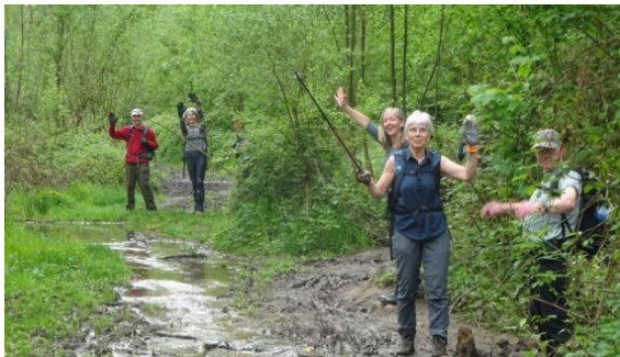
Mei 2024: Ploeteren in de bever-vallei van Ri d'Héz