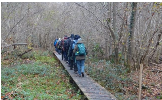
December 2023: Vlonderpad in moerrasige Birrebeekvallei