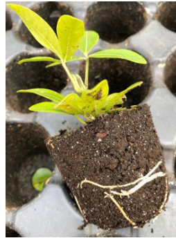
Jonge stek van Choisya

Dit seizoen starten we een nieuwe reeks waarin we de vermeerdering van tuinplanten in detail bekijken. Tijdens deze workshops ga je zelf aan de slag zodat je daarna één en ander kan toepassen met de planten uit je eigen tuin. Vooraleer je start met de praktijk, krijg je telkens de nodige achtergrondkennis.