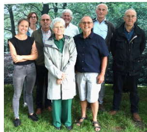
Huidig bestuur 2022 - 2026

Welnu, 30 jaar later, is de vereniging een begrip in het Waasland en ver daarbuiten. Onze 30 werkende leden en 60 vrijwilligers baten de cafetaria uit en organiseren jaarlijks meer dan 40 educatieve events voor ruim 1600 deelnemers. We hopen dit verhaal nog jaren voort te zetten. Nieuwe vrijwilligers zijn van harte welkom! Laat je horen via info@hortus-ter-saksen.be